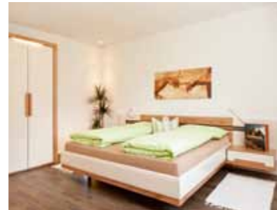
Appartement „Kirchbach“ ca. 50 m 2