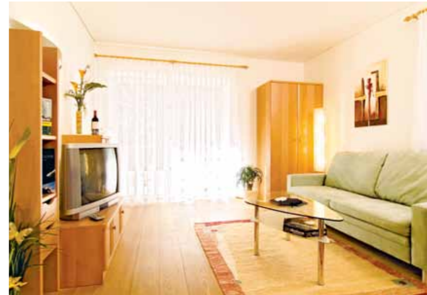
Appartement „Golden“ ca. 55 m 2