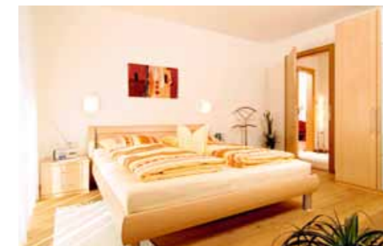
Appartement „Gala“ ca. 55 m 2