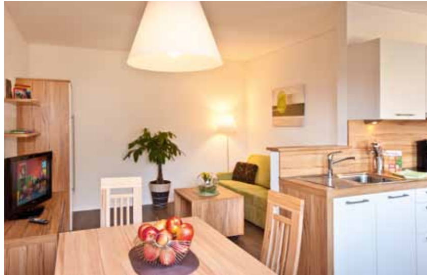
Appartement „Hirzer“ ca. 50 m 2

Nieuw in ons aanbod zijn de appartementen in de aangrenzende Tribushof. Verschillende afmetingen, maar zonnig en royaal ingericht met veel liefde voor de details. „U gewoon goed voelen“ is hier het motto voor uw verblijf.